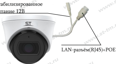
Рис. 1 Схема подключения видеокamеры