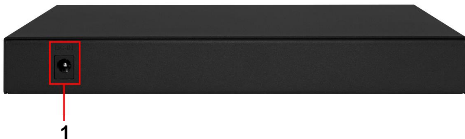
Рис. 3 Коммутатор SW-8D-1, разъемы и клеммы на задней панели