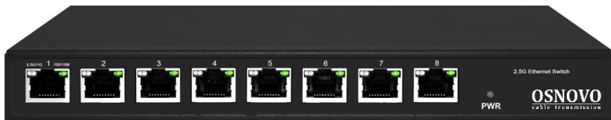
Рис.1 Коммутатор SW-8D-1, внешний вид