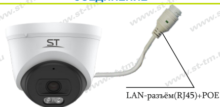
Рис.1 Схема подключения видекамеры