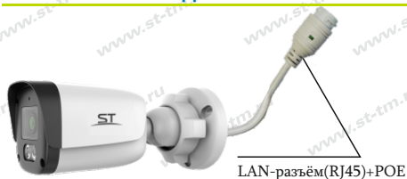
Рис.1 Схема подключения видекамеры