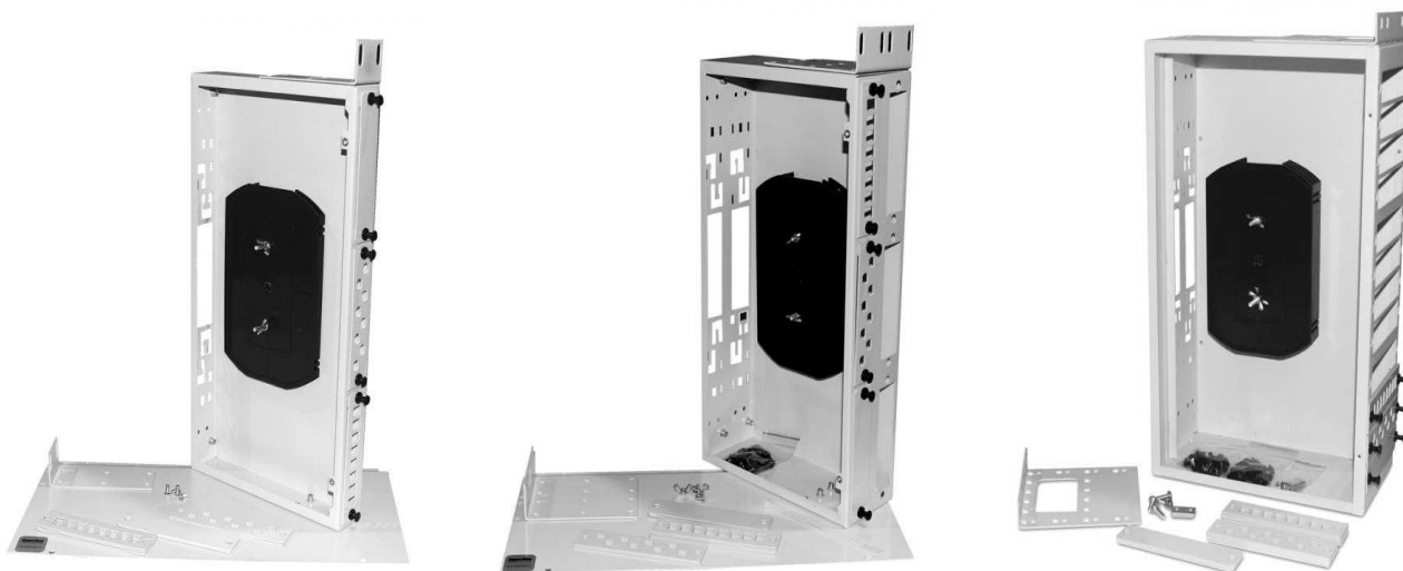
FO-19R-1U-3xSLT-W140H42-24UN-GY FO-19R-2U-6xSLT-W140H42-48UN-GY FO-19R-3U-12xSLT-W140H42-96UN-GY